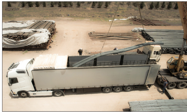
راه حمایت از تولید ملی، صادرات است.

فولادی به دلیل صدور بخشنامه اخذ عوارض از محصولات صادراتی توسط ستاد محترم تنظیم بازار، کاهش چشمگیری یافته، به طوری که حجم صادرات میلگرد این مجتمع در فروردین و اردیبهشت ماه سال جاری به نصف کاهش یافته و صادرات شمش نیز به شدت دچار چالش است. وی افزود: این در حالی است که افزایش نرخ‌های جهانی در این دوره که به واسطه درگیری نظامی در اوکراین به وجود آمده، فرصتی طلایی جهت ارزآوری هرچه بیشتر تولیدکنندگان فولاد ایران بوجود آورده است. اما با این مصوبه، این فرصت از دست رفت و ضربه‌ای جبران ناپذیر به درآمدهای غیرنفتی کشور وارد آمد.