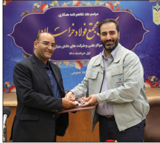
به موضوع «ساخت داخل»، رفع

چالش‌های اصلی صنعت از جمله در حوزه انرژی و کاهش وابستگی به خارج است. گفتنی است آیین انعقاد تفاهم نامه‌های همکاری میان مجتمع فولاد خراسان با دانشگاه‌ها و مراکز علمی-پژوهشی در روز یکشنبه اول خرداد ماه ۱۴۰۱ در محل سالن اجتماعات فولاد خراسان برگزار شد.