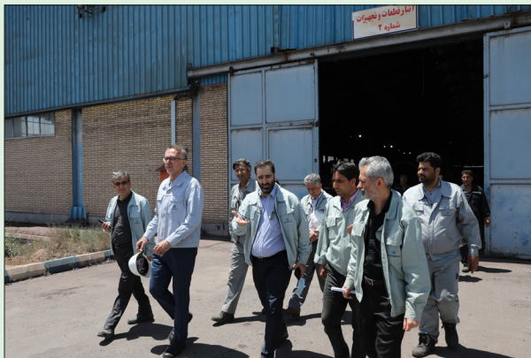
بهبود فرایند ها صادر کرد؛ تاکید بر تعیین تکلیف اقلام

تقویت امکانات حفاظت فیزیکی از جمله مواردی بود که مدیرعامل شرکت بر پیگیری و اجرای آن تاکید نمود.