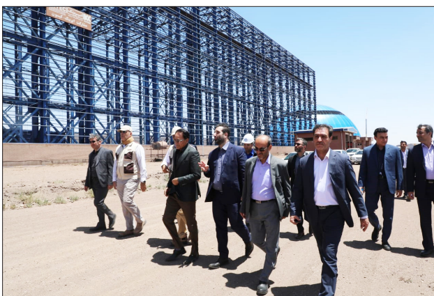
از تأثیر برنامه زمانبندی جدید در تسریع پیشرفت پروژه و ابعاد عملیات اجرا شده و فعالیت‌های

نایب رئیس هیات مدیره «صندوق بیمه اجتماعی کشاورزان، روستائیان و عشایر» و هیات همراه، صبح سه شنبه ۳۱ خرداد ماه ۱۴۰۱ از پروژه «آهن» در سنگان خواف بازدید نموده و روند پیشرفت کار و عملیات اجرایی کارخانه یادشده را بررسی کرد.