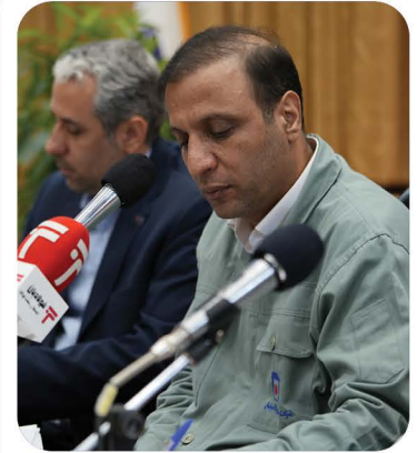
پیام مدیر عامل «مجتمع فولاد خراسان» به مناسبت روز خبرنگار